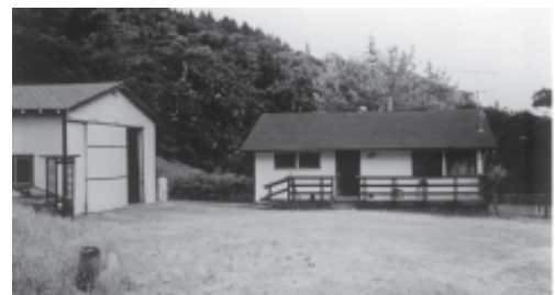
ที่ดินที่ซื้อเพิ่มมา ๑๓๐ เอเคอร์ มีบ้านและโรงรถติดมาด้วย บ้านนั้นใช้เป็นโรงครัว ที่ฉันอาหารและสำนักงาน มีห้องน้ำ ๑ ห้อง (ซึ่งเป็นห้องน้ำห้องเดียวในวัด)

อาจารย์ปสนโน และท่านอาจารย์อมโร จึงเลือกใช้ชื่อนี้ให้เป็นชื่อวัดป่าในสายของหลวงพ่ocha แห่งแรกในประเทศอเมริกา