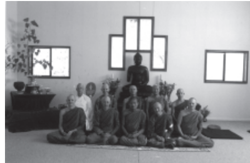
พระสงฆ์ สามเณร และผ้าขาว ที่จำพรรษา ณ วัดป่าอภัยคีรี ปี 2542

รูป และผ้าขาว 1 ทำให้สามารถรับกฐินได้เป็นปีแรก โดยมีคณะศิษย์และสถานีวิทย์ 01 มีนบุรี ที่มีศรัทธาได้ร่วมทอดกฐินเพื่อร่วมกันพัฒนาวัดครั้งนั้น ท่านอาจารย์เล่าว่า “โยมที่มีศรัทธาจากเมืองไทยก็ไปเป็นกำลังใจ 40 คน คนไทยคนลาวอพยพที่อยู่ที่นี่ก็ไปร่วมงาน รวมทั้งโยมฝรั่งด้วยก็เกือบ 200 คน