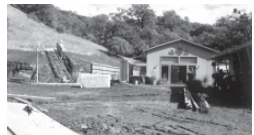
ส่วนโรงรถได้รับการปรับปรุง ต่อเติม เป็นศาลาปฏิบัติธรรมและปฏิบัติกิจของสงฆ์ซึ่งใช้ตั้งแต่เริ่มสร้างวัดจนถึงปัจจุบันนี้