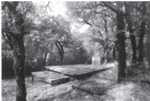
พระอุโบสถท่ามกลางธรรมชาติของวัดป่าอภัยคีรี ใช้สำหรับทำพิธีอุปสมบท

ร่าเริงที่เดียว คือควบคุมแล้วก็ปล่อยในลักษณะพอดีๆ ไม่ใช่ควบคุมจนเด็กเครียด