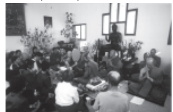
กฐินสามัคคีปีแรกของวัด เมื่อ 31 ต.ค. 2542